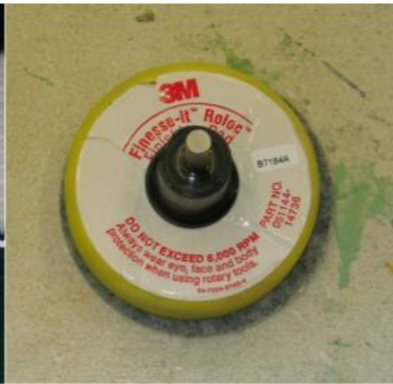
fig. 10 De 3M polijstspoons