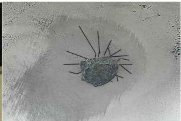
fig. 12 Ster blijkt groter, na inwrijven met grafiet