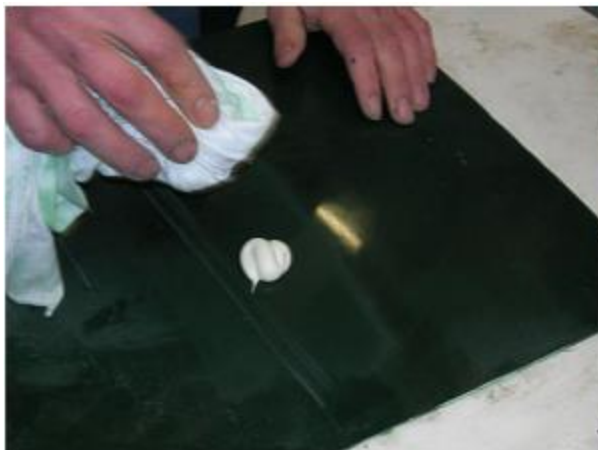
fig. 4 Polijstpasta, aardig wat, voor een klein vlak

Als u met de hand poetst, maak dan draaiende bewegingen. Verderop laten we zien dat het ook met de machine kan.