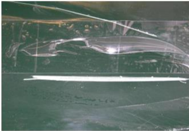
fig. 6 Diepe kras, met aan één kant tape

Tape op het naastliggende gedeelte zorgt ervoor dat tijdens het later vlak schuren van de nieuw aangebrachte gelcoat een zo klein mogelijke plek geschuurd wordt, en u dus ook zo weinig mogelijk oppervlakte hoeft te polijsten.