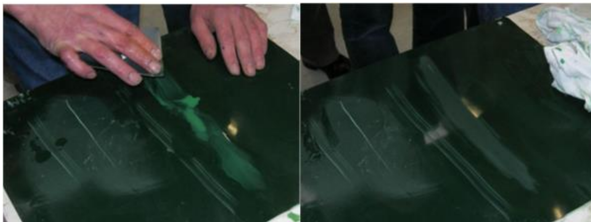
fig. 1 Ondiepe krassen, en schuren met 600

Schuurt u op een vertikaal deel van de romp: houd een natte spons erboven en knijp daar af en toe in, regelmatig spoelen is dat.