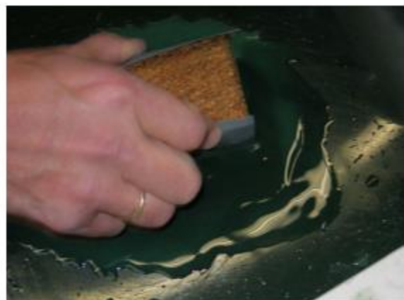
fig. 8 Schuren met een kurkblokje