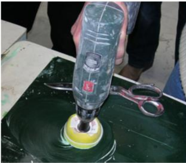
fig. 9 Polijsten met machine

Nadat alles vlak is kunt u gaan polijsten, met de hand of met een machine (fig. 9). De machine-polijstspoonsjes zijn van 3M (Finesse-it Roloc Pad). Er zit klittenband op, dus het polijstvlak is te vervangen.