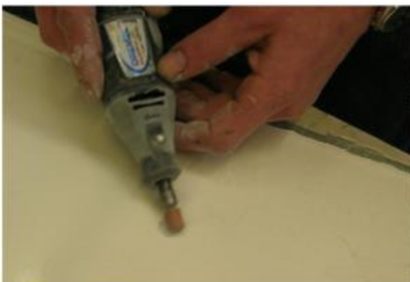
fig. 11 Slijpen met Dremel en slijpsteentje

Die ster moet in zijn geheel weggeslepen worden, voordat u gaat repareren. Dat slijpen kan het beste met een Dremel en een klein slijpsteentje (fig. 11). Met de hand met grof schuurpapier kan ook (duurt even), of met een scherp voorwerp (is een beetje link).